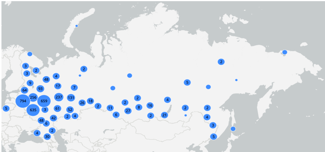
Рисунок 1 - Количество населенных пунктов с численностью населения менее 5 человек

Для выделения сельских населенных пунктов по единственному критерию «численность населения» предложено исключить из числа населенных пунктов следующие категории: город, район, поселок, станица, поселок городского типа, рабочий поселок, населенные пункты с численностью населения менее 5 человек. Для последующего анализа сельского расселения в наборе данных осталось 91 113 населенных пунктов с численностью населения от 6 человек до 35 062 человек, в которых проживает 28 559 131 человек (рис. 2).